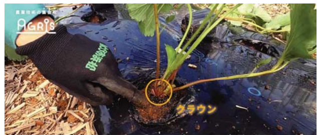
苗を植え穴に入れ、土をかぶせます。 根元のクラウンに生長点があるため、土で埋まらないようにしましょう。